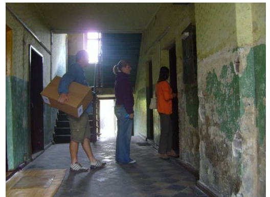
Veel vervallen flatgebouwen met donkere en kleine appartementen met vaak deplorabele voorzieningen.