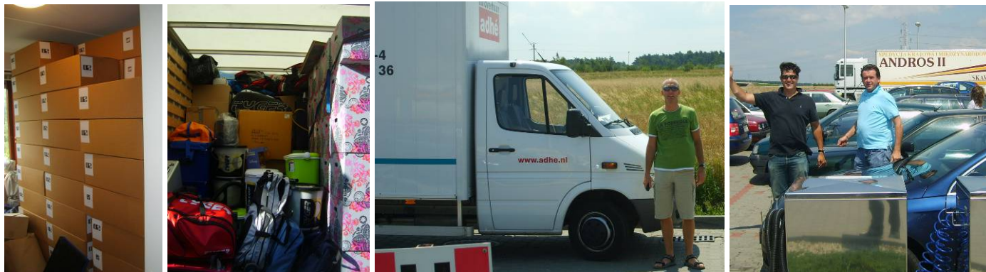
Uiteindelijk op stap met de Adhe-express en 18 m3: 150 dozen kinderkleding en schoenen, 24 kinderpakketten, 20 familiepakketten, 1000 tennisballen, 60 rackets, 60 voetballen en basketballen, volleybalnetten en tennisnetten, mega veel pakjes sultana, disco, ballenkanon, zwembad, etc. , etc.,

Maar als je eenmaal in Polen bent en je ziet al die blije gezichten dan weet je dat het al die ontelbare uren voorbereiding meer dan waard is.